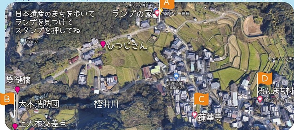
A. ランプの家 B. 大木消防団 C. 蓮華寺 D. みんなまち村